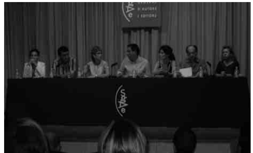
Reunió de la Plataforma de les Arts Escèniques.