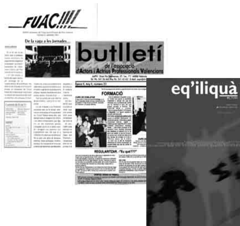
Portades de la primera edició de FUAC!!!, del Butlletí i del número 1 de l'Equilibrà.