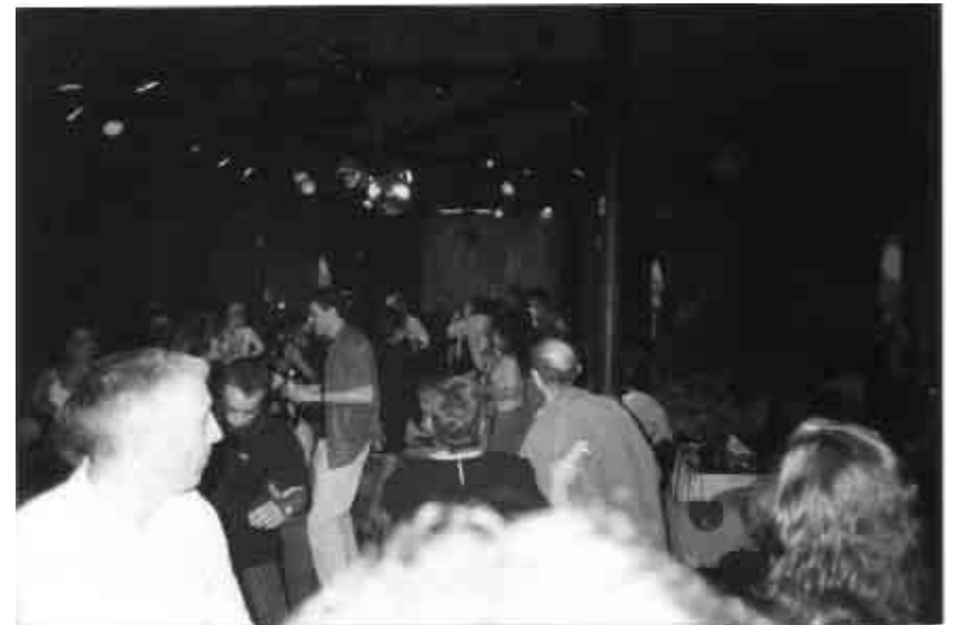
Festa de l'AAPV celebrada a Casablanca.

Per tant, a finals dels vuitanta, començava a engendrar-se un teatre de caire més professional, alhora que el doblatge es va convertir en una opció de treball alternativa per a guanyar-se la vida. Dos opcions diferents que obrien possibilitats de feina però que, al