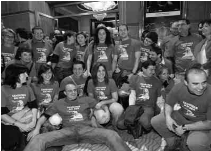
Protesta davant del teatre Principal.