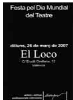
Programes de mà de la festa (1990, 2001, 2007).

En quant als premis i les festes ja es lliuraven i celebraven des de l'inici de l'Associació. El Premi Narcís es lliura cada any en reconeixement a aquella persona o entitat que ha treballat i ha aportat el seu treball a favor del fet teatral. És un reconeixement de companys a companys. Encara que els premis no sempre han tingut aquest sentit, ha variat durant el temps. A principis dels noranta es lliuraven premis de caràcter positiu i negatiu. Altres anys els premis s'han atorgat per categories: millor actor de teatre, millor actriu de televisió... En els últims anys es marca un línia més regular: