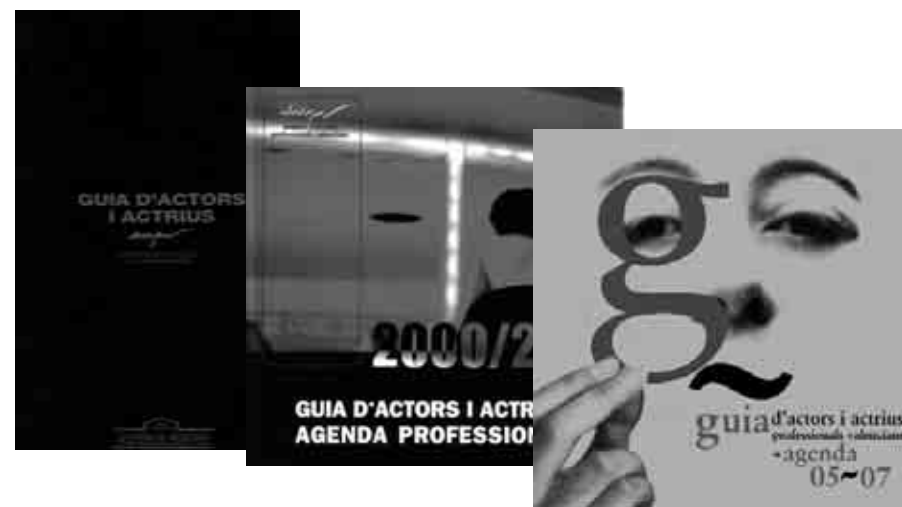
Portades de la Guia d'Actors i Actrius de 1991, 2000 i 2005.