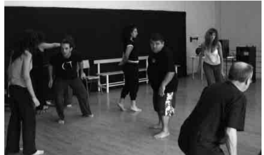
Curs organitzat per l'Associació en 2007.

tre. Sense producció al Centre Dramàtic i sense ajudes, la situació per als actors i actrius podria ser molt complicada. "S'estan carregant el teatre públic" era una de les frases més repetides. Eixe divendres s'aturaren les representacions del Rialto, del Talia, de l'Olympia -on estava actuant durant eixos dies la Companyia del Teatre Negre de Praga- i del Teatre Principal. Aquesta última aturada és la que més ressó públic i mediàtic tingué. Era la nit de l'estrena de "Cabaret" al Principal. Durant el dia, els membres de l'Associació havien parlat amb els actors de la companyia perquè no representaren l'obra. Al final, es va arribar a un acord, s'aturaria la representació però es podria reprendre després de la mitjanit, ja que pel contracte que tenia la companyia no podien romandre sense actuar. A la nit, un gran nombre d'associats i associades de l'AAPV s'apropà fins al Principal, pagà l'entrada i ocupà la seua butaca al teatre. En uns dels canvis d'escena, els membre de l'AAPV deixaren les seues localitats i pujaren a l'escenari. Va ser un moment de desconcert per al públic. Es va llegir un manifest explicant el motiu de la vaga. Alguns espectadors van romandre a les seues cadires, altres marxaren i uns altres esperaren al bar. Finalment, passada la mitjanit, es reprengué la representació de "Cabaret". Amb la vaga s'aconseguí, almenys, obrir un període de diàleg entre el sector teatral i els organismes públics per a valorar i tractar la situació del teatre del moment.