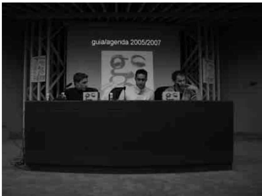
Presentació de la sisena edició de la Guia d'Actors i Actrius.

Un altre fet destacat d'aquesta etapa es produí un any abans de l'aparició d'OSAAEE, és a dir, l'any 1999. A partir d'aquesta data l'AAPV compta amb membres al Consell Rector de Teatres de la Generalitat Valenciana. A més a més, també es realitzen diferents protestes davant de TGV.