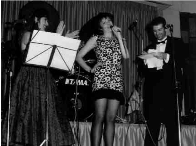
Festa i lliuraments dels premis de l'Associació de 1992.