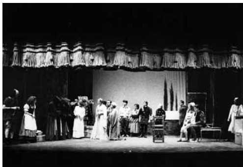
“Los figurantes”, CDGV.

El Servei d'Assistència i Recursos Culturals de la Diputació de València va nàixer al maig de 1989 amb la principal tasca d'assistir als municipis de la província en matèria cultural, concretament en els pobles amb menor nombre d'habitants o amb menys recursos econòmics. Per aconseguir-ho, els objectius s'orienten per a: satisfer les necessitats culturals dels municipis de la província, ampliar l'oferta de serveis, potenciar la creativitat i cultura valenciana, assessorar i formar en matèria cultural o donar suport l'enfortiment de les indústries culturals. Curiosament, l'Ajuntament de València, que en anys anteriors havia mostrat un gran interès per difondre el teatre com a fet cultural popular en diferents llocs i per a diferents públics (campanyes de teatre infantil i de carrer dels parc públics, les setmanes culturals dels barris, la fira de juliol, i fins i tot, Expo-jove), inicia en 1989 el gran camí cap a la sequera teatral de la pròpia institució i deixa de recolzar diferents iniciatives privades amb vocació pública que sorgiren posteriorment.