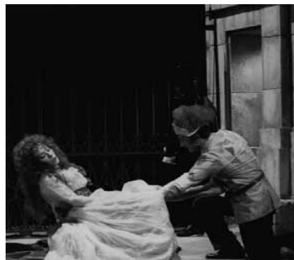
"La marquesa Rosalinda"

En 1988 el Centre Dramàtic de la Generalitat Valenciana va estrenar la primera producció "La Marquesa Rosalinda", de Valle-Inclán. Fins que va arribar aquesta, hi hagué un període de coproduccions des de 1985 entre Cultura i algunes companyies privades. Durant eixos anys de trànsit fins que es posaren en marxa altres serveis i espais culturals, com ara l'IVAM, el Palau de la Música i el Teatre Rialto (futura seu del CDGV). En aquest últim es van estrenar les produccions: "L'home, la bèstia i la virtut" i "Los figurantes", entre d'altres.