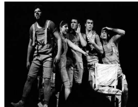
"Cadiram", de La Cassola.