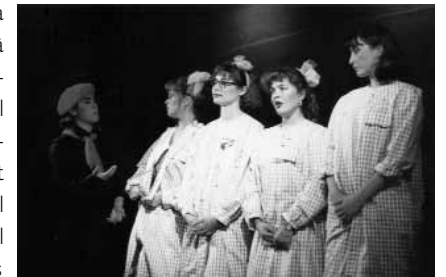
"Elvis", de Jácara Teatre.