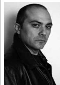
Paco Gisbert, actor